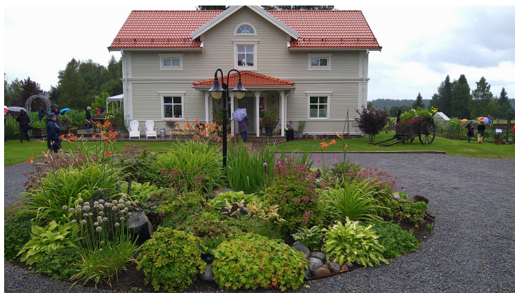
Planteringen framför huset

Ett stort trädgårdsland, med massor av kålsorter, väl inhängnat för att hålla ute traktens glupska djur.