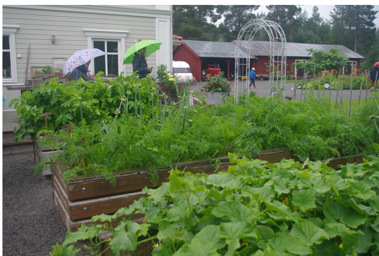
Plantering i oldlingslådor. I bakgrunden stallet som flyttats dit och byggts upp stock för stock.

Nästa trädgård var en villaträdgård på 1.100kvm belägen utmed Skellefteälven. Trädgården har växt fram under de 30 år Ove och Ulrika ägt fastigheten. Trädgårdens topografi var en plan del och en lika stor del slänt ner mot älven (med egen brygga).