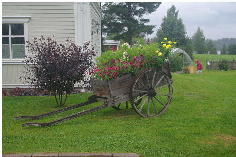
Blommor i vagn